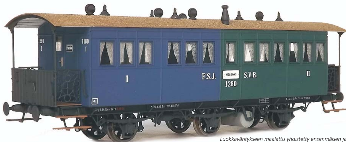
Luokkavärytykseen maalattu yhdistetty ensimmäisen ja toisen luokan vaunu on näyttävä pienosmalli.

Edellisessä uutiskirjeessä kerroimme peltivuorattujen vaunujen kehitystyöstä. Kokoonpanoidea on vielä hivenen jalostunut ja nyt olemme saaneet ensimmäiset prototyypivaunut valmiiksi.