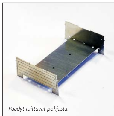
Päädyt taittavat pohjasta.

Sisänurkan voi helposti juottaa kiinni nurkan sisäpuolelta kapealla kolvin kärjellä.