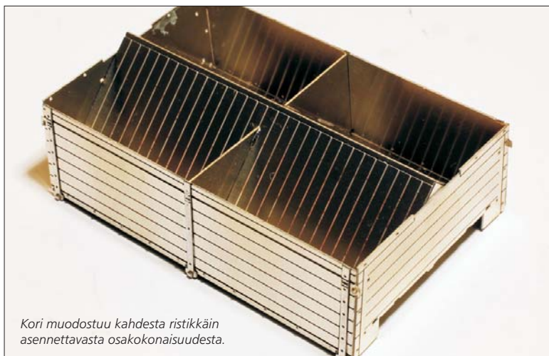
Kori muodostuu kahdesta ristikkäin asennettavasta osakokonaisuudesta.