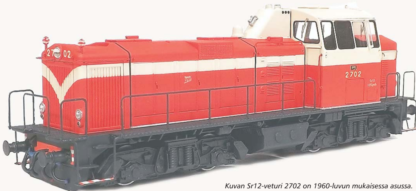
Kuvan Sr12-veturi 2702 on 1960-luvun mukaisessa asussa.