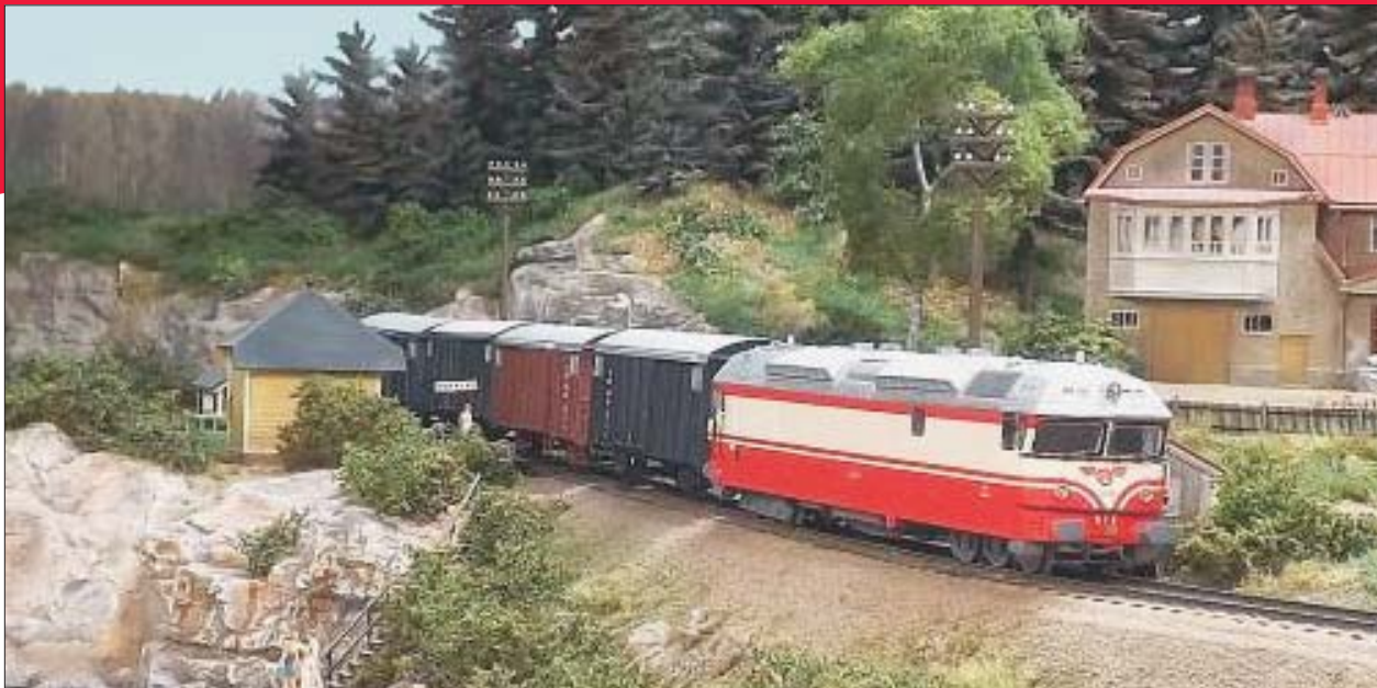
Tilaustyönä rakennettu veturi ja vaunuja.